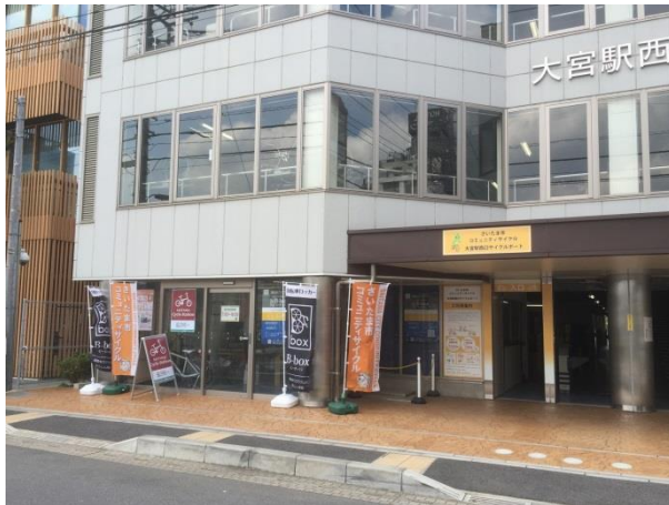
大宮駅西口 SAITAMA Cycle Station に設置

日本コンピュータ・ダイナミクス株式会社（本社：東京都品川区、代表取締役社長：下條 治、以下NCD）は、埼玉県内で初となる自転車専用ロッカー「B-box」による駐輪場を、大宮駅西口のSAITAMA Cycle Station（さいたまサイクルステーション）にオープンいたしました。