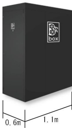
省スペースでの設置が可能