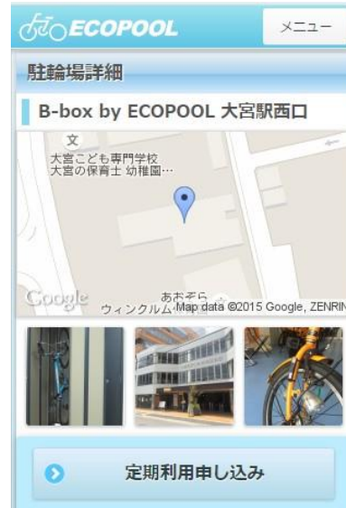
月極め契約お申込み画面