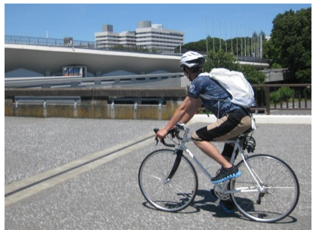
スポーツ自転車による通勤イメージ