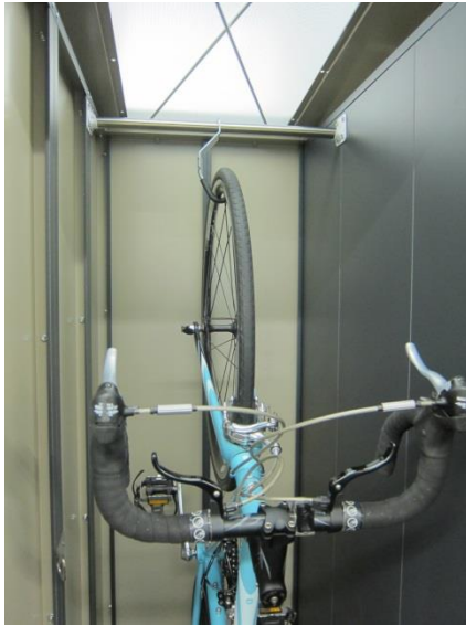
自転車収納の様子