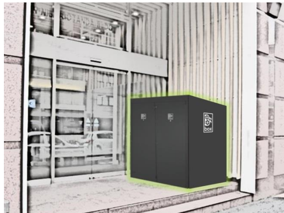
デッドスペースでの設置イメージ