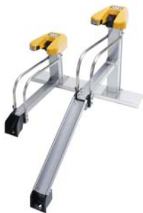
個別電磁ロック式駐輪機

NCDは、IT企業として培った技術とコンサルティング力を生かし、日本各地の駐輪問題を解決し、地域の皆様に快適な暮らしを広げていきます。